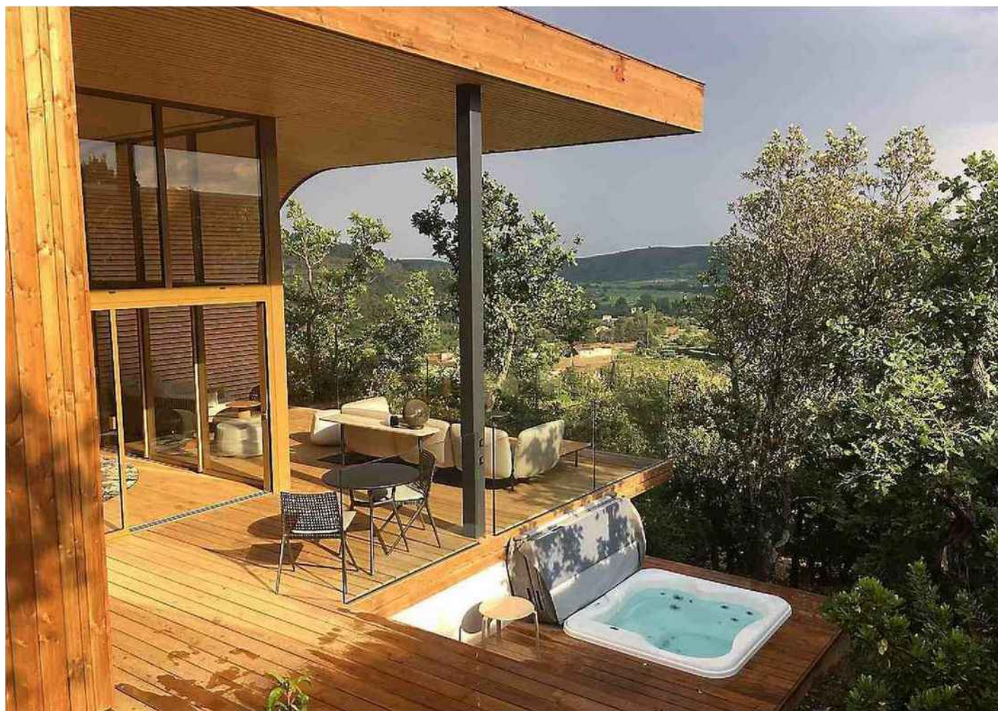
Après l'orage, la lumière revient sur les coteaux de Cabrières. Les jacuzzis privés proposent d'agréables moments de détente...