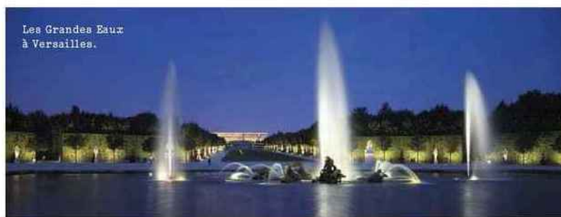
Les Grandes Eaux à Versailles.

La Lido Academy ouvre ses portes au public avec une nouvelle expérience immersive au cœur de son cabaret des Champs-Élysées. Les Bluebell Girls et Lido Boys se transforment pour l'occasion en coachs exclusifs lors de trois ateliers : séance sportive (yoga, Pilates...), chorégraphie (hip-hop ou un tableau du